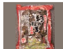
幻の椎茸 全国でも菊池市だけで栽培されている贅沢な食材です。 問/ 熊本県椎茸農業協同組合 TEL 096-380-3300