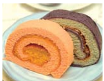
トマトのロールケーキ 阿蘇地域では、トマトを使ったケーキやお菓子がたくさん。 問/阿蘇地域観光推進協議会 TEL 0967-22-3903