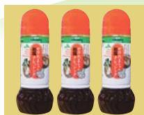
サラたまちゃんドレッシング サラたまちゃんのペーストを25%以上配合。甘みと旨味が凝縮。 問/ JAあしきた 農産物直販センター TEL 0966-82-2272