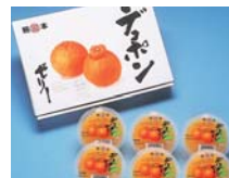
デコボンゼリー デコボンを贅沢に使ったゼリー。夏もデコボンを楽しめます。 問/ JAあしきた 農産物直販センター TEL 0966-82-2272