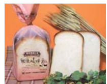
肥後の麦畑 県産小麦「ミナミノカオリ」100%使用の食パン。ほのかな甘みや香りが特徴。 問/ 熊本県パン協同組合 TEL 0968-26-4255