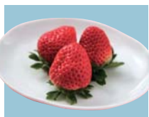
イチゴひのしずく 熊本県オリジナル品種「ひのしずく」は粒の大きさと甘さに自信があります。 問/ (株)エーコープ熊本 熊本農畜産物直販店you+you TEL 096-341-7070