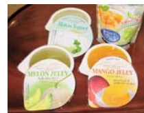
メロンゼリー & シャーベット メロン果汁20%使用のゼリーとシャーベット。メロンの風味まるごと味わえます。 問/ 道の駅「七城メロンドーム」 TEL 0968-25-5757