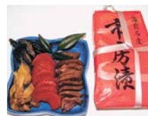
市房漬 地元産の野菜類を手作り味噌に漬けた素朴な味わい。 問/ 下村婦人会市房漬加工組合 TEL 0966-43-3827