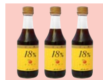
デコボンぼん酢 特産のデコボンを18%使用した香り豊かなぼん酢です。 問/ JAあしきた 農産物直販センター TEL 0966-82-2272