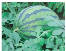
スイカ 日本一のすいかの産地。程よい甘さとみずみずしさか喉を潤します。 問/ (株)エーコープ熊本 熊本農畜産物直販店you+you TEL 096-341-7070