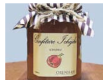
いちじくのコンフィ 地元で採れたいちじくをジャムにしました。 問/ 三角オレンジ会 TEL 0964-54-1111 (JA熊本うき内)