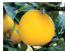
河内晩柑 甘さと酸味のバランスがとれた果汁をたっぷり含んでいます。 出荷時期/3〜6月 問/ (株)熊本フルーツセンター TEL 096-384-8080