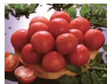
トマト 熊本は、生産量日本一。一年を通しておいしいトマトが栽培されています。 問/ (株)エーコープ熊本 熊本農畜産物直販店you+you TEL 096-341-7070