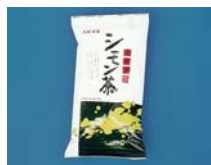
シモン茶 シモン芋の葉や茎から作られたお茶。ミネラル分と繊維質が豊富。 問/ (株)くらたけ TEL 0969-64-3500