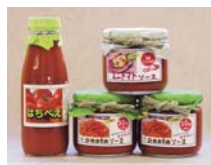
トマトケチャップ 完熟の八代産トマト「はちべえ」で作ったケチャップ。本物の味です。 問/八代地域農業協同組合 TEL 0965-35-6236