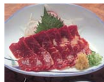
馬刺し とろけるような舌触りと甘みは熊本自慢の味。 問/熊本県畜産課 TEL 096-333-2398