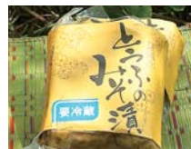
とうふの味噌漬 地元で作られたとうふを味噌にじっくりと漬けます。 問/ 森林の停車場ごかんしよ TEL 0965-67-5300