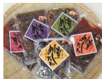
山里のめしだね 地元の山菜等を使ったまぜごはんの素。 問/ 清和物産館 「四季のふるさと」 TEL 0967-82-2727