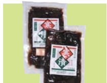
寒漬 塩漬けた大根を寒風に晒して旨味を閉じこめました。 問/ みなまた観光物産館 「まつぼっくり」 TEL 0966-62-2003