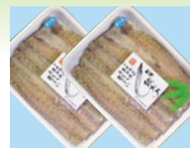
タチウオのみりん干し 水俣・芦北地域特産の新鮮なタチウオを使った美味しいのみりん干しです。 問/ 田浦漁業協同組合 TEL 0966-87-0035