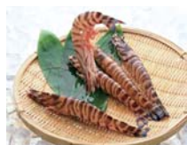
クルマエビ 平成元年に「県魚」に制定された。熊本を代表する水産物です。 問/ 天草漁業協同組合 TEL 0969-27-7371