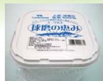
ヨーグルト球磨の恵み 人吉・球磨の生乳100%使用。とろ〜りとした食感が人気です。 問/ 球磨酪農農業協同組合 TEL 0966-35-0681