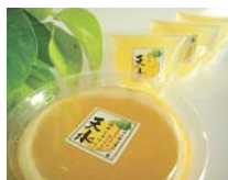
晩柑ゼリー 熊本特産の河内晩柑のゼリー。ビタミンたっぷり。 問/ なな・みかん工房 TEL 0968-71-5355 FAX 0968-82-2544