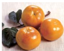
柿・太秋 サクサクとした食感と甘さは柿のイメージ一新です。 出荷時期/10月〜11月 問/ (株)熊本フルーツセンター TEL 096-384-8080