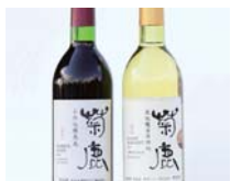
菊鹿ナイトハーベスト 夜収穫してその日に仕込むという意味。程よい酸味と渋みが調和したワイン。 問/ あんずの丘 TEL 0968-48-3100