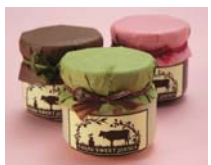
スイートジャージー ジャージー牛乳と生クリームで作った風味豊かなジャム。 問/ ミルクジャムの会 TEL 0967-46-5832