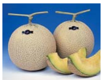
メロン メロン王国熊本、アールスメロン、肥後グリーンなど多彩な種類が栽培されています。 問/ (株)エーコープ熊本 熊本農畜産物直販店you+you TEL 096-341-7070