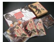
タコすてーき 有明産の地タコをまるごと柔らかく煮付けました。 問/ ありあけワーキング TEL 0969-54-0360