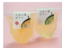
であい梨ゼリー 青みかんの果汁と梨の出会い。さわやかなゼリー。 問/ であい梨工房あべあ TEL 096-277-2321