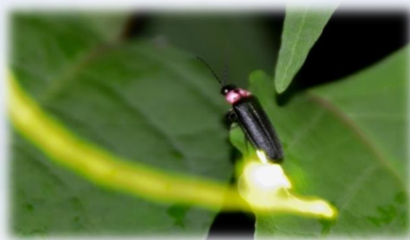
清流万江川のホタル

また、義務教育の給食費無料化や高校卒業までの医療費無料化など、子育て支援も充実しています。