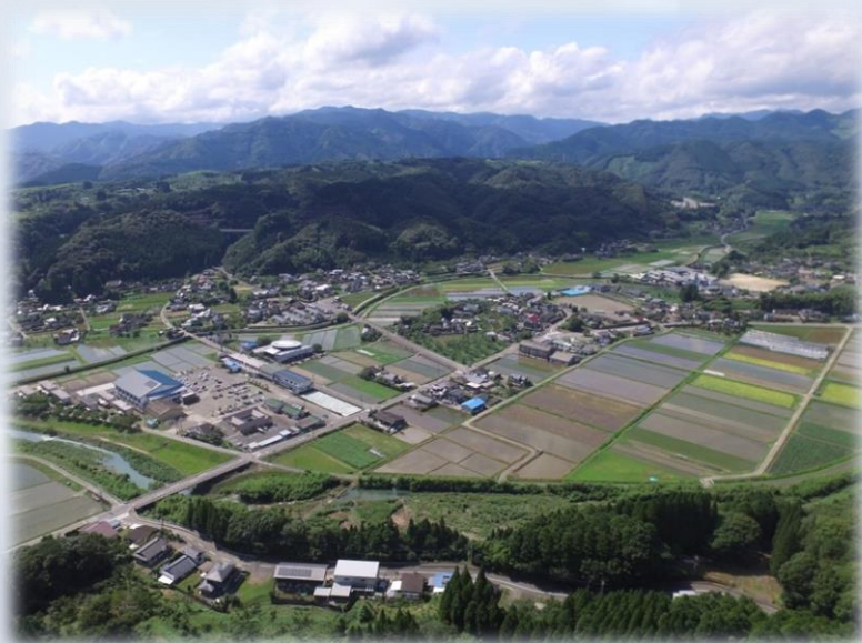
山江村の田園風景

・熊本県の南部に位置し、熊本市内から車で約90分。オフィスやスーパーがある人吉市へ約10分の場所にある自然あふれる山里です。