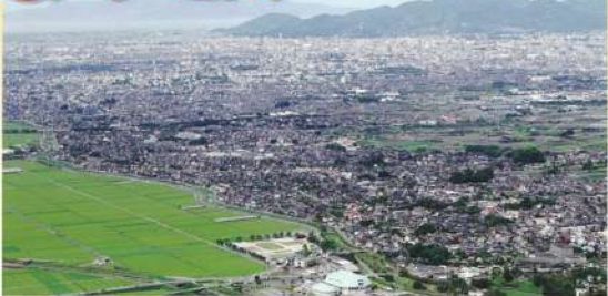
益城町東部から 熊本市を望む

町内の中心部を東西に貫く主要幹線道路にバスが走っており、約30分で熊本市中心部に行くことが出来、通勤や通学にとっても便利です。